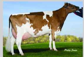
Lombard Dale Nemo Helen