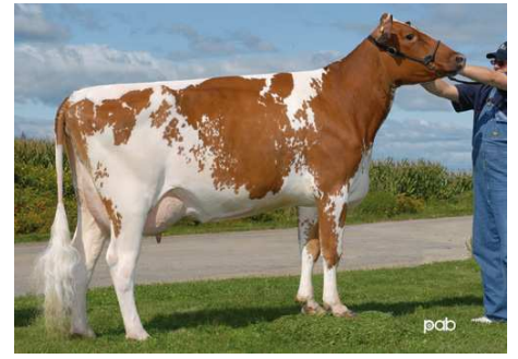
Ayr-Phoe Mo Katrina 2006