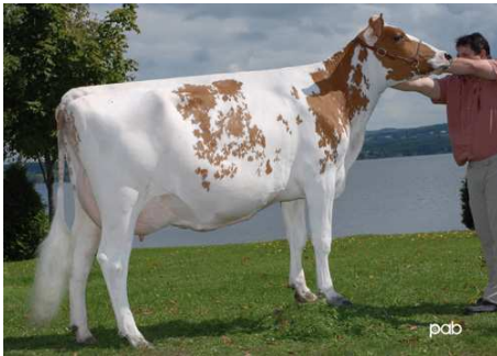
Bellevue du Lac Modem Gaby 2006