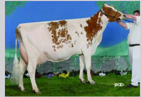
Bellevue Du Lac Modem Gaby

Besättningar: 77 Dottrar: 101 Säkerhet: 86% EBV 10*APR