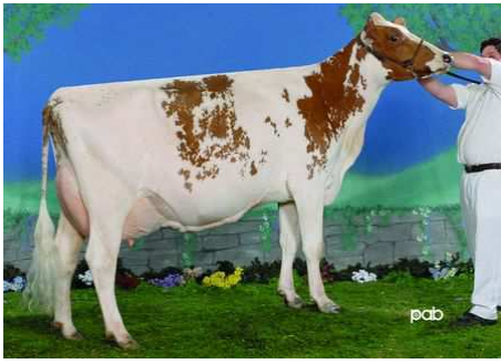
Bellevue Du Lac Modem Gaby