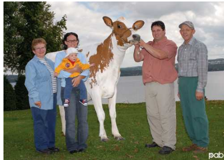
Bellevue du Lac Modem Gaby 2006