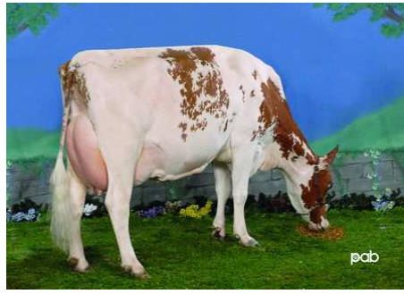
Bellevue Du Lac Modem Gaby