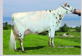
Du Bosquet Kilowatt Casta