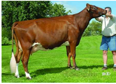
Fabiola Rosalie - 2008