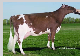
Denier Jupiter Iris