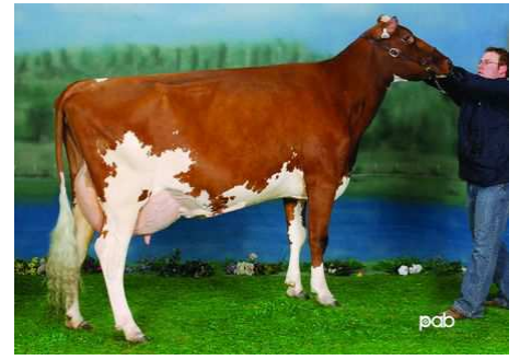
Des Rasades Jupiter Route - 2009