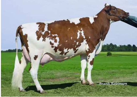
Glenmalcolm Jupiter Betska - 2009