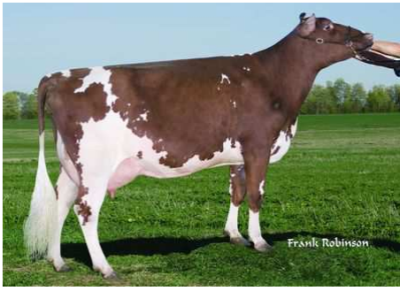
Denier Jupiter Iris - 2008